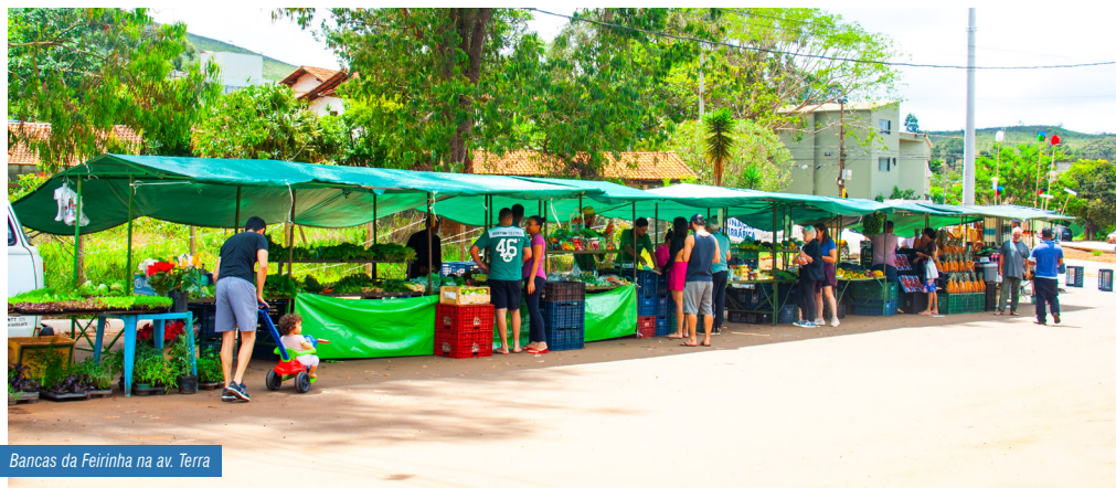
Bancas da Feirinha na av. Terra