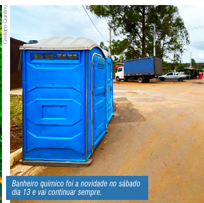
Banheiro químico foi a novidade no sábado dia 13 e vai continuar sempre.